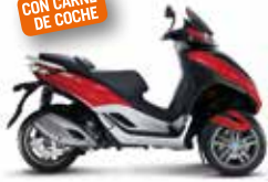
MP3 YOURBAN LT